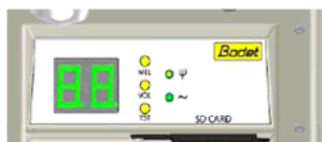
Clavier du Melodys